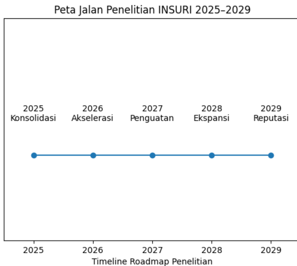
Gambar 4.1 Grafik Timeline Peta Jalan Penelitian INSURI 2025–2029

Periode lima tahun ini dirancang dalam lima fase pengembangan yang saling berkesinambungan: Konsolidasi (2025), Akselerasi (2026), Penguatan (2027), Ekspansi (2028), dan Reputasi (2029). Setiap fase memiliki fokus, karakter, dan capaian yang berbeda, namun tetap berada dalam satu kerangka besar penguatan mutu penelitian berbasis tata kelola yang profesional.